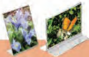
Porta hojas inyectados

Soportes de mostrador para hojas intercambiables o folletos, fabricación standard con personalización de logotipos o diseño y fabricación previo briefing, de cualquiera de las piezas. Aluminio, inyectados, acrílicos, metal o combinación de varios. Amplia gama de tamaños en los productos standard.