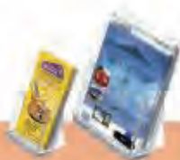
Porta folletos inyectados