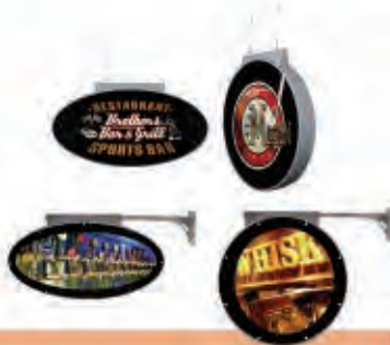
Banderolas de Exterior