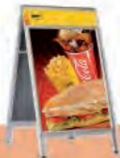
A Board Deluxe