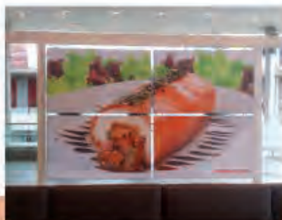
Tenso System Doble Cara