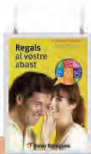
Marco Doble Cara