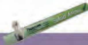
Frentes de Lineal con Pinza

Impresión directa sobre material plástico, sin accesorios, permite el troquelado. Fijación con o sin adhesivo. Dimensiones según proyecto