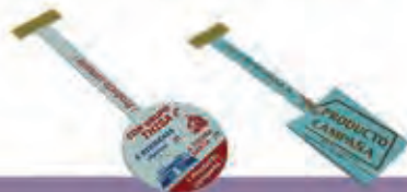
Stoppers Frontales con Adhesivo