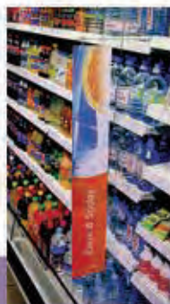
Banners para Lineal