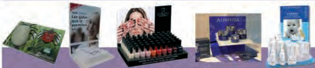
Expositores de mostrador