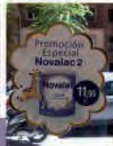
Adhesivos de suelo, Vinilos y Electrostáticos de cristal