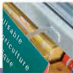
Componentes para Stoppers