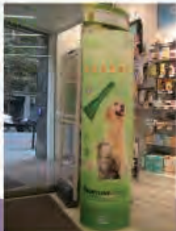
Tótem cubre alarmas