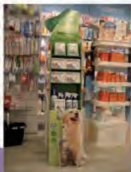
Expositor de suelo

Gestión del picking o la implantación de todos los soportes que producimos.