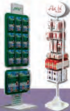
Expositores de suelo

Diseño y fabricación de expositores personalizados. Aluminio, chapa, metacrilato, poliestireno, polipropileno, PVC. Mecanizados y corte por láser, termo conformados... Pequeñas tiradas y series grandes. Expositores de mostrador, suelo, pared o estantería. Combinaciones de materiales para optimizar costes. Impresión por serigrafía, stamping, láser u offset según el proyecto y la cantidad.