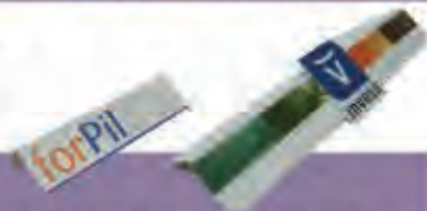
Frentes Flexibles con adhesivo

Impresión directa sobre material plástico, sin accesorios, permite el troquelado. Fijación con o sin adhesivo. Dimensiones según proyecto